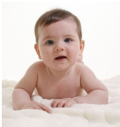
Rys. 7: Raczkujące dziecko.

Większość ludzi oczekuje natychmiastowych rezultatów. Pamiętaj jednak, że osiągnięcie celów to nie przygotowywanie posiłku fast-food! To sztuka, którą jeśli dobrze opanujesz — zadziwi Cię swoimi wynikami! Trzeba jednak czasem poczekać... Daj sobie czas i kolejne próby, w razie niepowodzenia.