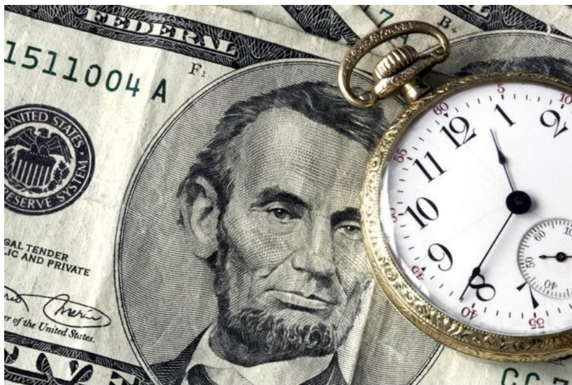
Rys. 6: Czas to pieniądz.