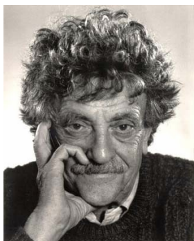
Rys. 5: Kurt Vonnegut.

Strategia osiągania celów Vonneguta pochodzi od znanego, genialnego powieściopisarza — Kurta Vonneguta. Odzwierciedla ona sposób, w jaki Vonnegut pisał swoje książki, tworząc fabułę i rozwijając wątki od tyłu.