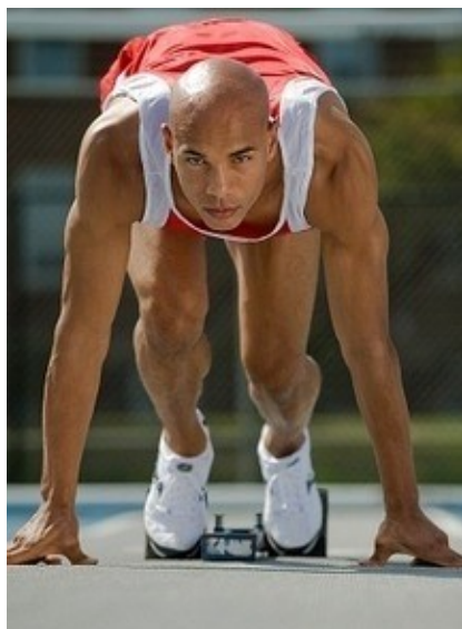
Rys. 8: Koncentracja na celu.

Kluczową umiejętnością prowadzącą do osiągnięcia celu jest umiejętność koncentracji na nim. Wszyscy ludzie sukcesu nauczyli się koncentrować się na jednej rzeczy i trwać przy niej tak długo, aż zostanie zrobiona. Skupienie to zdawanie sobie sprawy z tego, czego się chce. Koncentracja to dyscyplina i siła woli, która pozwala Ci poruszać się w obranym kierunku, aż do końca.