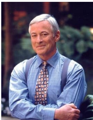
Rys. 4: Brian Tracy

Kilka słów o autorze metody. Brian Tracy jest dziś jednym z najbardziej uznanych w świecie mówców szkoleniowych w zakresie budowania osobistego i zawodowego sukcesu. Przemawia co roku do ponad 300 tysięcy osób.