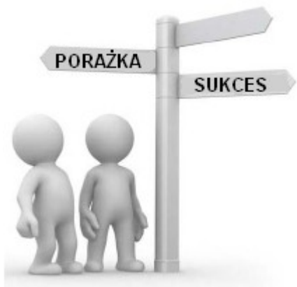
Rys. 1: Wybór należy do Ciebie.

A więc w tym kursie liczy się to, jak szybko wprowadzasz wiedzę w życie i wykonujesz ćwiczenia.